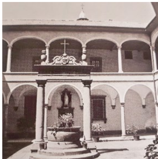
La Cartuja de Farnetta. Italia.

1909. El 22 de marzo deja el monasterio para asombro de sus propios compañeros de La Cartuja que lo apreciaban por su afecto, por su suave carácter, su modestia, puntualidad y su cultura. Seguramente pesó en la recomendación del Superior su debilidad física. Pero el mismo José Gregorio en carta a su amigo César Dominici del 7 de octubre de 1912 escribe: “Lo que encontré en La Cartuja superó toda descripción. Vi allí la santidad en grado heroico, y te puedo asegurar que una vez visto ese espectáculo lo demás de la tierra se vuelve lodo, y en ese lugar celestial yo tuve la dicha de vivir nueve meses. Pero sucedió lo que era natural que sucediera al que cegado por la pretensión y apoyado por su egoísmo había emprendido tan alto vuelo. Carecía de muchas dotes requeridas en el Instituto. No tuve las suficientes fuerzas físicas para resistir al frío, al ayuno y al trabajo manual, porque has de saber que yo me había ido en un estado de acabamiento físico tan grande que solo pesaba noventa y siete libras. No tenía suficiente latín ni la demás ciencia indispensable para la profesión religiosa.