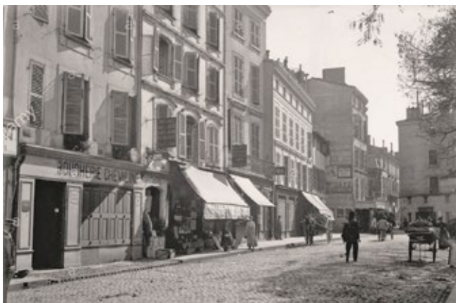
París. Rue des Carmes N° 20.

Coincide la llegada de José Gregorio Hernández a París en los días que aún se vivía la euforia artística y cultural de la Exposición Universal que había congregado enormes y variadas actividades y exposiciones, incluyendo la inauguración de la Torre Eiffel.