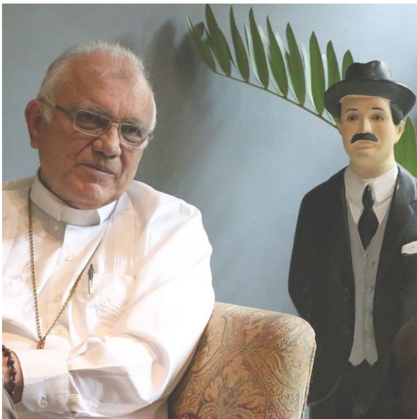
Monseñor Baltazar Enrique Cardenal Porrás Cardozo