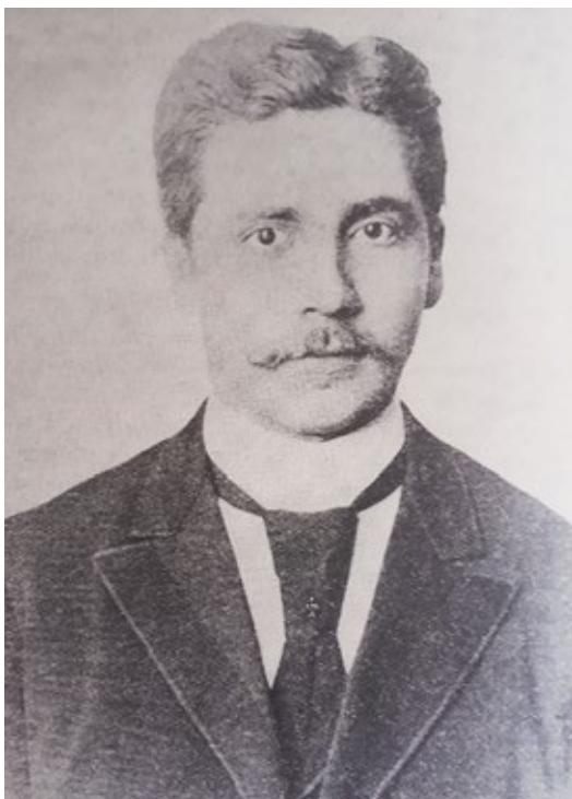
José Gregorio Hernández. Paris.1890

1891 En enero se inaugura en Caracas y pone en marcha el hospital nacional con el nombre de Hospital Dr. José María Vargas, una obra de enorme trascendencia para la medicina venezolana, toda vez que era una instalación moderna que incluía además de la atención médica actividades docentes y de investigación en sus laboratorios, para lo cual se estaba preparando el Dr. José Gregorio Hernández.