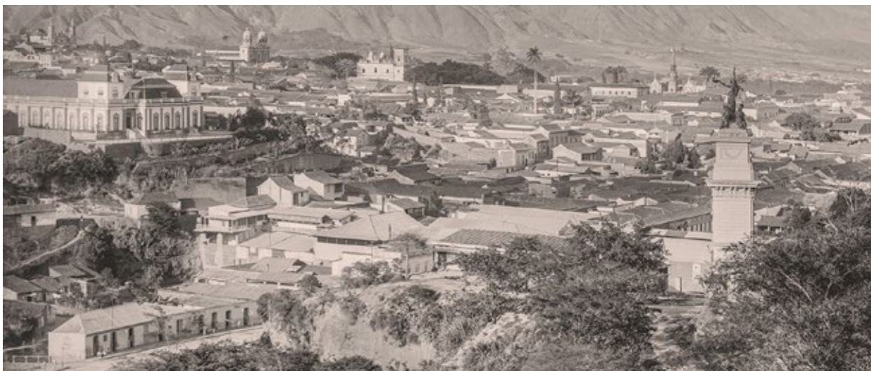
Caracas. Año 1900