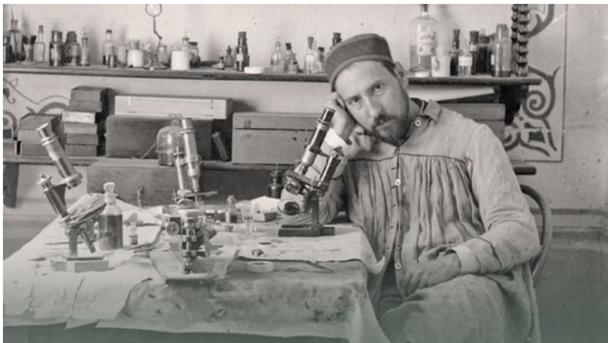
Santiago Ramón y Cajal

compartieron el Premio Nobel de medicina. Asiste todos los días a la Iglesia en la que está el Santo Niño de Atocha.