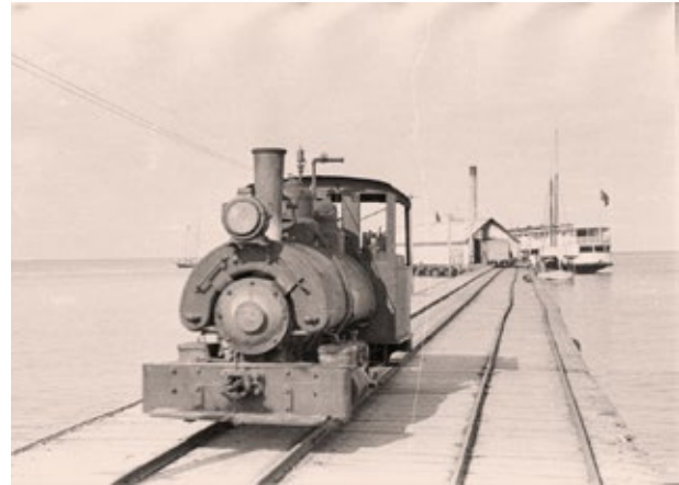
Ferrocarril de La Ceiba.