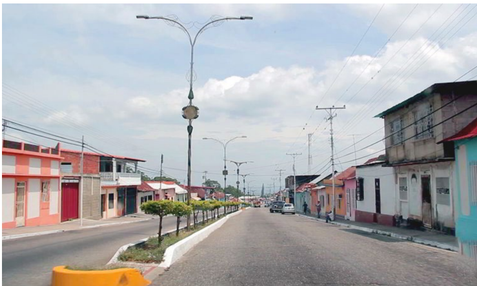
Calle de Betijoque.