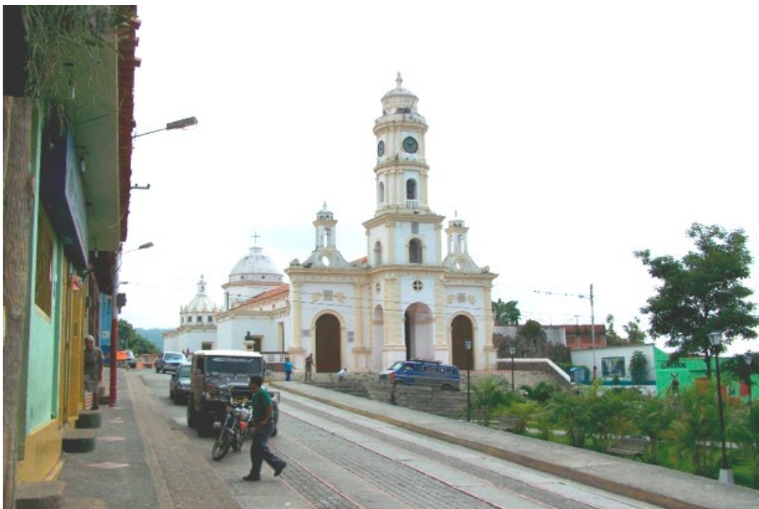
Iglesia del Santo Niño Jesús de Escuque.