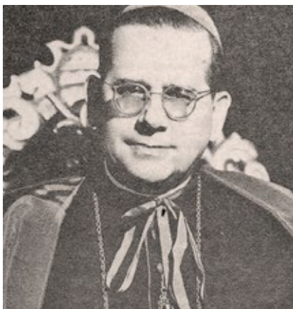
Mons. Rafael Arias Blanco