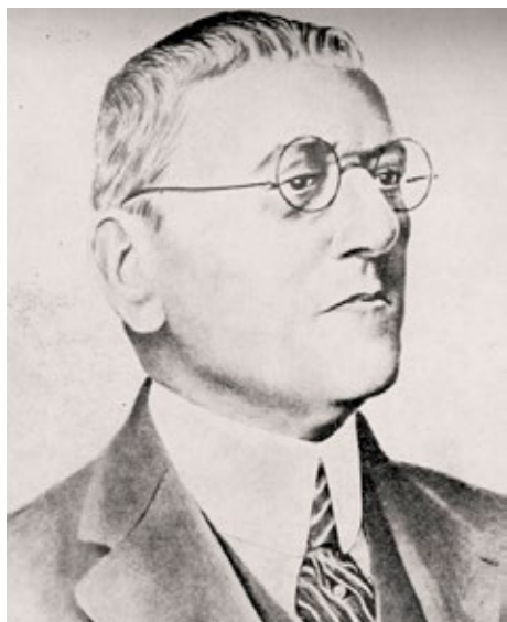
Dr. Luis Razetti.