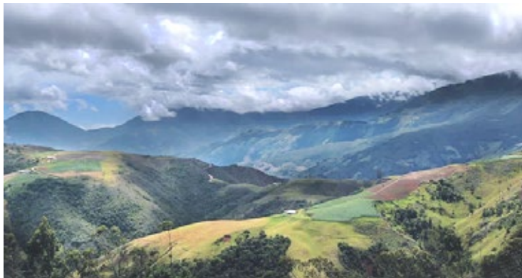
Páramo El Zumbador.