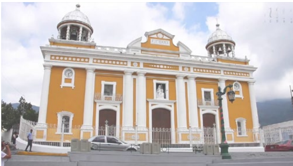
Iglesia de La Pastora

1888. Este año culmina sus estudios formales de medicina, en total 21 cursos en los cuales obtuvo 13 sobresalientes y en todas siempre por encima del promedio general de la clase. Tuvo en toda la carrera 59 inasistencias, la mayoría por problemas de salud, cuando sufrió de fiebre tifoidea. En esos tiempos los estudios de medicina eran muy teóricos y tradicionales, no existían buenos laboratorios y los hospitales eran muy deficientes, fallas que eran compensadas por la excelencia de los profesores entre los cuales destaca el Dr. Calixto González, un hombre preparado que había sido discípulo del Dr. José María Vargas, culto, excelente ciudadano y promotor de diversas campañas de salud pública, quien presidió la Junta de Médicos que en 1888 hizo todo lo necesario para la creación del Hospital Nacional que llevaría el nombre del Dr. Vargas. El Dr. Calixto González fue la persona fundamental para que se seleccionara a José Gregorio para ir a París y Berlín a especializarse en medicina experimental, adquirir los equipos necesarios, instalar