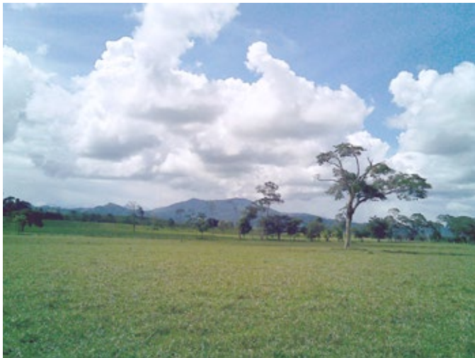
Llanos de Pedraza, Estado Barinas.