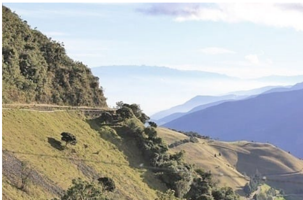
Páramo de La Negra.

acompañantes. Se sabe por él mismo que fue a la ciudad de San Juan de Colón, seguramente por la ruta de Michelena. El regreso a Isnotú debió ser por la misma ruta de La Grita a Mérida y Timotes, por lo que debió haber pasado de nuevo por los páramos de El Zumbador, La Negra y El Águila. Este contacto con el frío extremo, los fuertes vientos y aquellas enormes serranías, de profundos desfiladeros e impresionantes paisajes, debió causar una transformación interior en el joven galeno, ya religioso y espiritual.