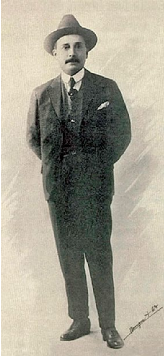
Fotografía tomada en Nueva York

nos microbios, en los puestos de adelante, a los lados y por detrás me quedan encantadoras estudiantas, mis condiscípulas del momento y que practican tan prosaico oficio, en fin de lo malo lo menos...” 20 .