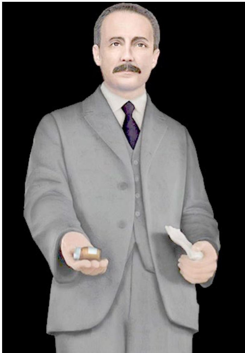
Imagen del Dr. José Gregorio Hernández de la Diócesis de Trujillo en la campaña de la beatificación. Sobre la base de la estatua de mármol que está en la Capilla del Santuario de Isnotú.

El viernes 19 de junio la Congregación para la Causa de los Santos publica el decreto con la autorización del papa Francisco para la beatificación del Venerable Dr. José Gregorio Hernández.