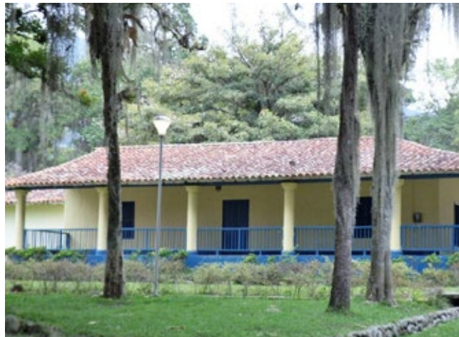
La Casona de La Isla.

res al lado del río Albarregas y se quedan por 5 días hasta el Año Nuevo, en gratos encuentros con amigos y colegas, bailando y conociendo la ciudad. Visita la Universidad y su Escuela de Medicina, sus templos y plazas.