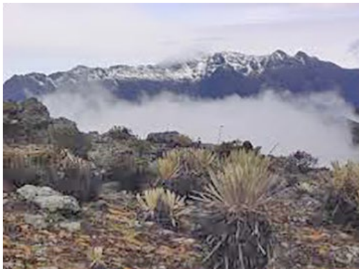
Páramo de El Águila.