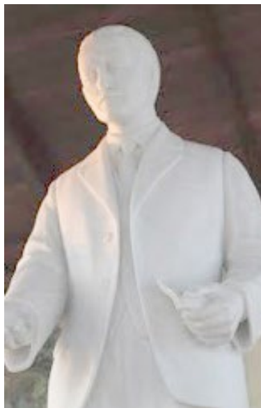
Estatua en mármol en Isnotú.