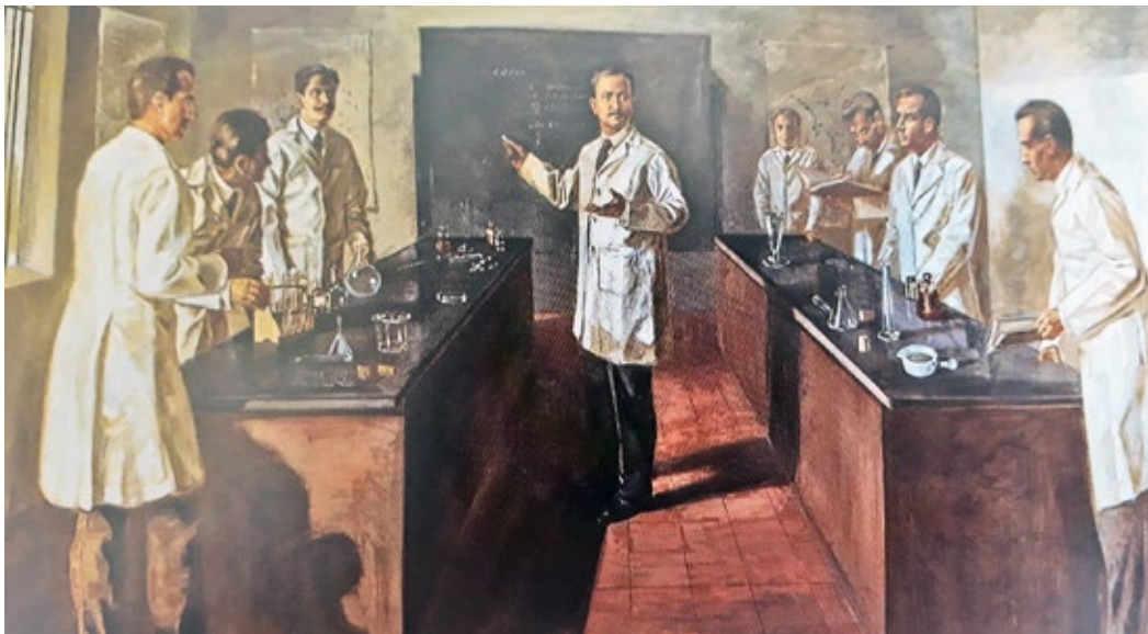
El Dr. Hernández en su laboratorio. Al fondo a la izquierda Rafael Rangel. Obra pintada por Iván Belsky. Museo de Isnotú

1899. El 14 de agosto el Dr. José Gregorio Hernández designa Preparador de la Cátedra de Fisiología al Br. Rafael Rangel, en cuyo cargo permanece hasta el 1 de abril de 1903 cuando renuncia para ocupar la jefatura del Laboratorio del Hospital Vargas 18 .