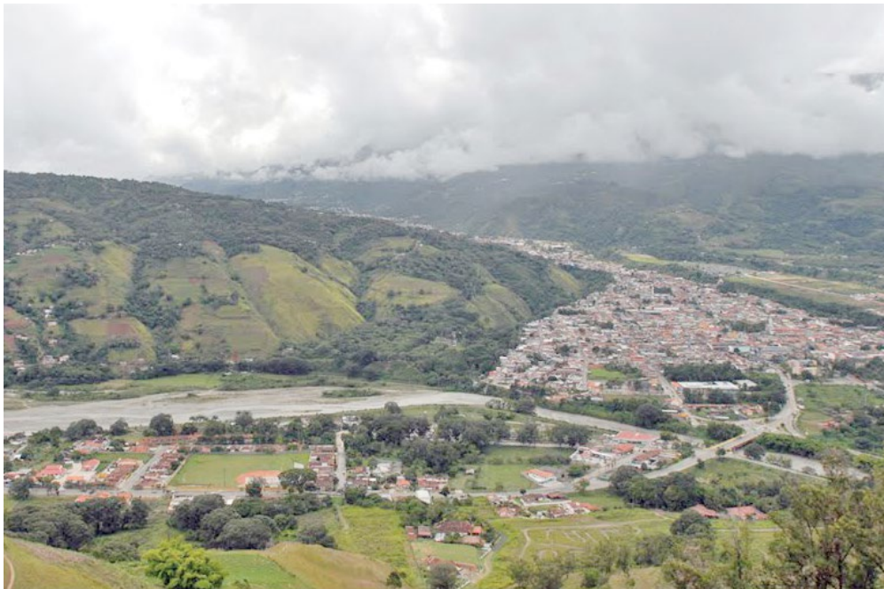
Boconó.