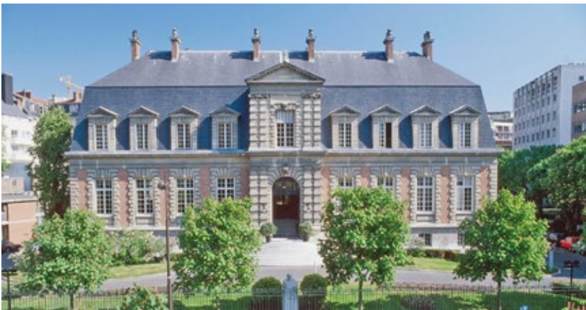
Instituto Pasteur. París

so Instituto Pasteur, fundación sin fines de lucro dedicada a la investigación, educación y prevención de enfermedades infecciosas que cuenta con doce premios Nobel de Medicina. Trabaja y realiza cursos en el laboratorio de Histología y Embriología con su director y creador de la embriología en Francia el profesor Mathías Duval. El Dr. José Gregorio Hernández domina el idioma francés, circunstancia que le favorece comenzar inmediatamente a aprender técnicas de laboratorio, fundamentos de la teoría celular, anatomía microscópica, estructura celular, formación de tejidos básicos, mecanismos de reproducción celular y embriología.