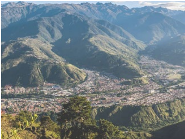
Panorámica de Mérida.