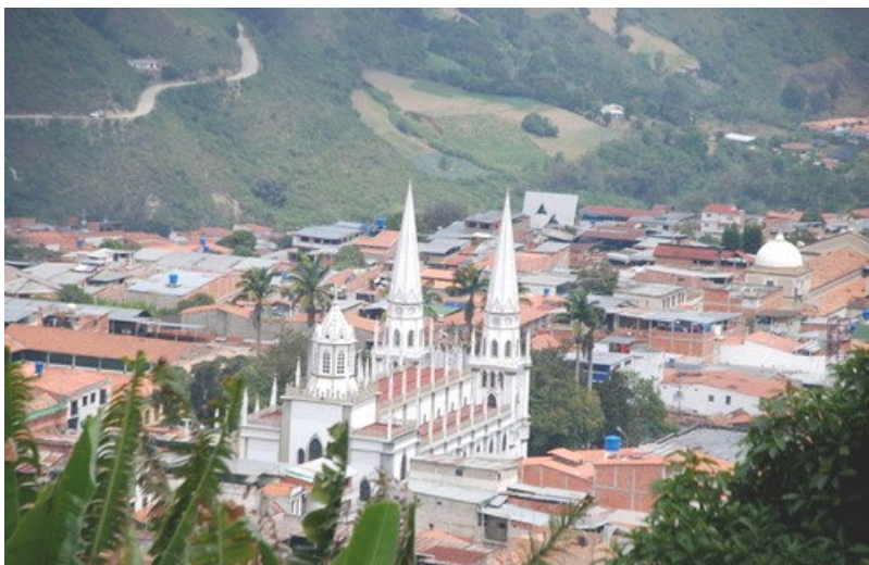
La Grita. En primer plano la Iglesia de Los Ángeles.

gran actividad cultural, A esta fecunda labor se debe en gran parte que a La Grita se le mencione como “La Atenas del Táchira” 16 . La poetisa afirma que el joven médico de Isnotú visitó varias veces a Mons. Jáuregui y lo ayudó en su lucha contra la epidemia de fiebre amarilla. Incluso que dejó como regalo de despedida un breviario de cabecera y una guía médica, firmada por Hernández.