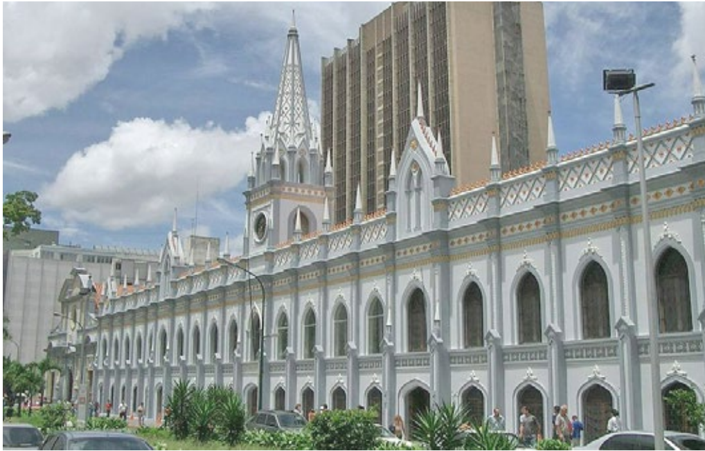
Universidad Central de Venezuela. Hoy Palacio de La Academias

título, que le permitía entrar a estudiar medicina en esa Universidad.