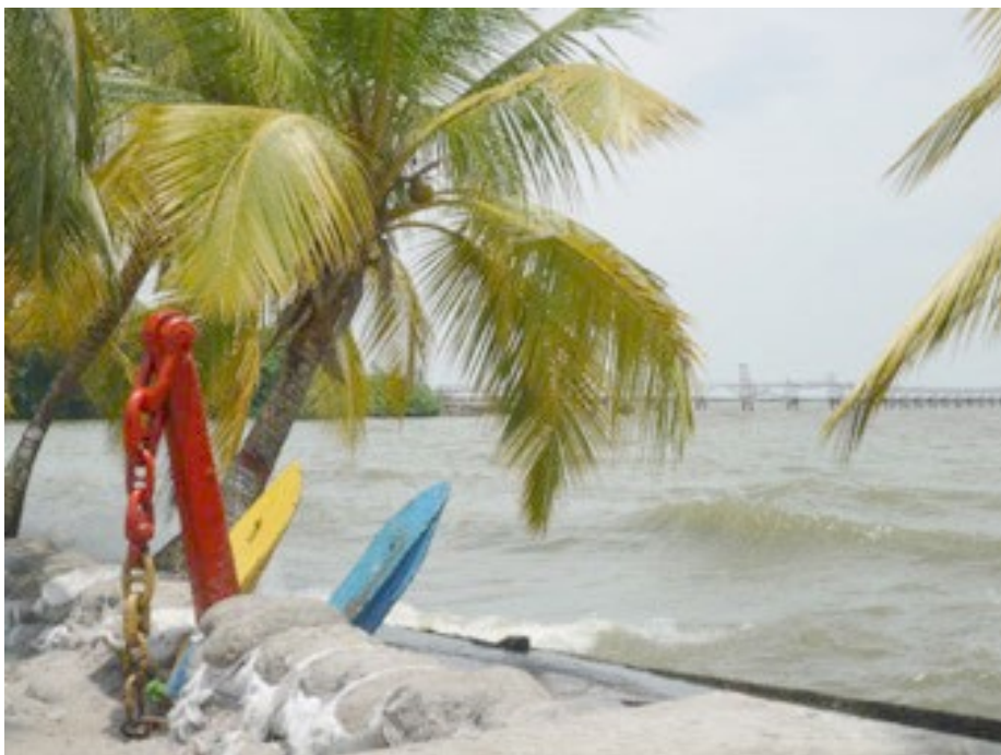
Puerto de La Ceiba, Estado Trujillo.