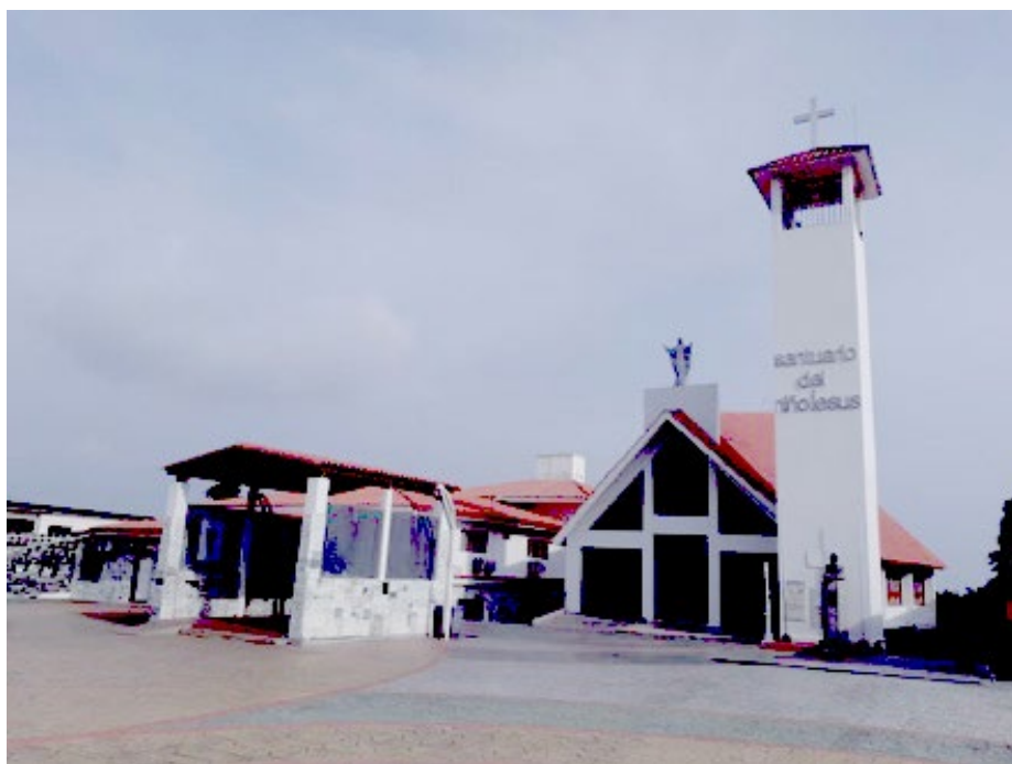
“Santuario del Niño Jesús” en Isnotú.

1969. El 29 de junio con motivo del cincuentenario de la muerte del Dr. Hernández, Roma ordenó la revisión de sus restos.