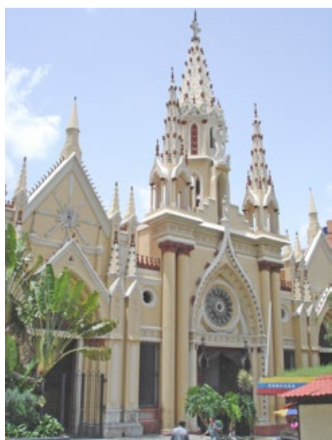
Iglesia de La Santa Capilla