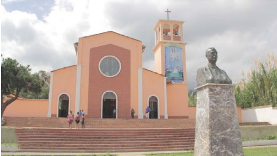
Iglesia de Nuestra Sra. del Rosario. Isnotú.

pio Betijoque, que le habían cambiado el nombre por Rafael Rangel y ahora tiene otra vez el antiguo nombre. El primer censo nacional de 1873 registra en Isnotú (parroquia Libertad) 756 habitantes, actualmente unos 6.000.