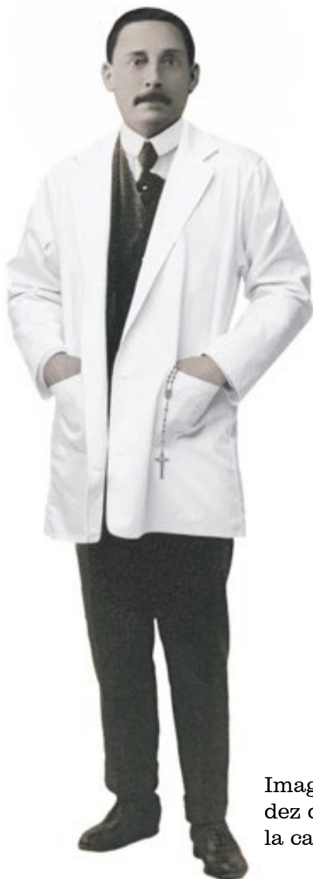
Imagen del Dr. José Gregorio Hernández de la Arquidiócesis de Caracas en la campaña de la beatificación.