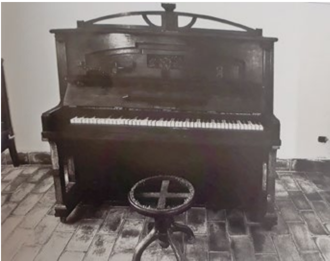
Piano de José Gregorio Hernández. Museo de Isnotú.

El Dr. José Gregorio Hernández era muy disciplinado lo que le permitía realizar sus múltiples actividades con gran calidad y eficiencia. Se levantaba temprano rezaba sus oraciones y asistía a misa en la iglesia de La Pastora, regresaba a su casa a desayunar para a las 8 am iniciar las visitas a sus enfermos, almorzaba en su casa a las 12, de 1 a 2 y 30 de la tarde trabajaba con los preparadores de la clase o atendía algún enfermo y a las 2 y 45 salía para sus clases y trabajo en el laboratorio. En las noches se dedicaba a sus tertulias en la casa, estudiar, tocar piano y orar.