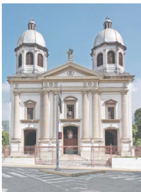
Iglesia de Las Mercedes