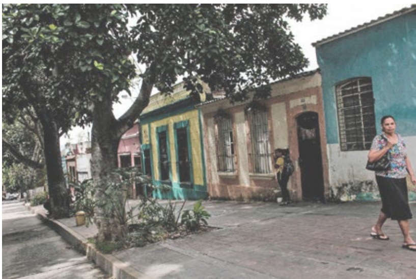
La Pastora. Caracas